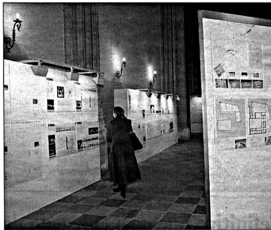
El Colegio Fonseca acoge desde ayer una muestra con los 33 trabajos presentados al concurso de rehabilitación de Fonseca